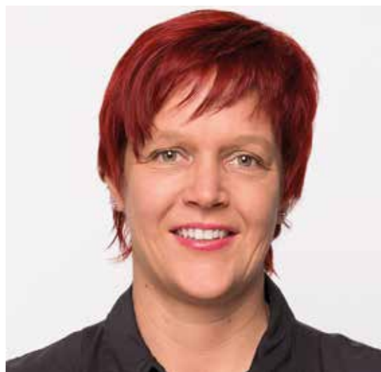
Susanne Ferschl © Linksfraktion im Bundestag

„Für die Arbeitgeber, die auf Dumpinglohnmodell setzen, hat die Ampel ein handfestes Geschenk im Gepäck: die Ausweitung von geringfügiger Beschäftigung. Die sogenannten Minijobs, die gerade im Gastgewerbe und im Einzelhandel ein gern