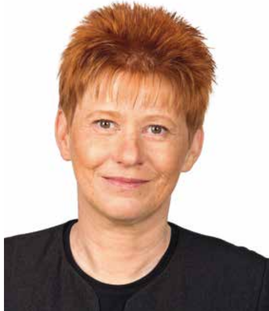
Petra Pau

und Piraten. Und DIE LINKE muss Pro-Botschaften setzen, für SOLAR und für DIGITAL, natürlich immer sozial. Und sie muss Hoffnung senden. Vie-