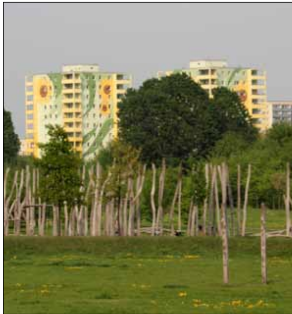
„Sonnenblumenhäuser“ - für viele ein Wahrzeichen für den Bezirksteil Hellersdorf.

Unser Bezirk Marzahn-Hellersdorf gehört in den Fragen der Bürgerbeteiligung, von Bürgerinnenmitwirkung und bei der Information über den Bezirkshaushaltsplan zu den positiven Beispielen in Berlin. In allen Stadtteilzentren haben sich aktive Bürgerinnen gefunden, die durch Kiezspaziergänge, die Einbeziehung der örtlichen Träger der Sozialarbeit, der Jugend- und Kulturarbeit, der Sportvereine sowie anderer Akteure sich dauerhaft mit den Problemen vor Ort befassen. Auf der Grundlage des Paragraphen 41 des Bezirksverwaltungs-gesetzes unterrichtete das Bezirksamt in den vergangenen Jahren die Bürgerinnen rechtzeitig und in geeigneter Form über die Grundlagen der wichtigsten Planungen, besonders beim Haushaltsplan. Dabei galt bisher der Grundsatz: Jeder, der am Bürgerhaushalt mitwirken will, kann dieses tun, unbeschadet seines Wohnsitzes oder Arbeitsplatzes, seines Alters oder seiner Staatsbürgerschaft.