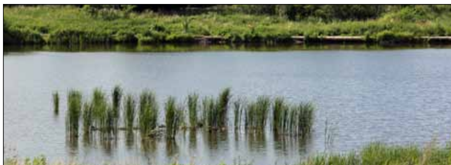
Natur vor der Haustür - dies hier ist nicht j.w.d., sondern mitten im Bezirk ...

Aktueller Terminhinweis: Landschaftstag des Regionalparkes Barnimer Feldmark am 17.03.2012 ab 9 Uhr im Freizeitforum Marzahn. Eintritt: 8,- Euro