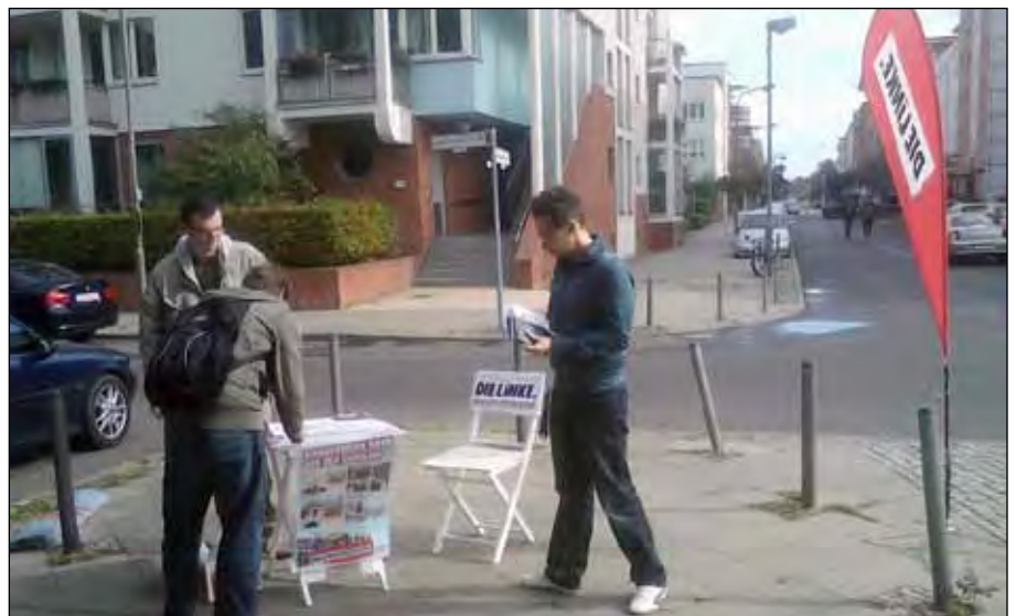
Der Infostand der Linksjugend am 24. September 2012 am Melanchthon-Gymnasium