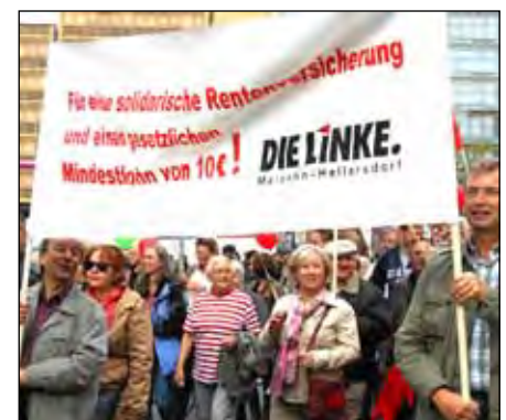
Protest in vielen Städten Deutschlands am 29.9. - hier in Berlin, mit dabei Marzahn-Hellersdorfer.