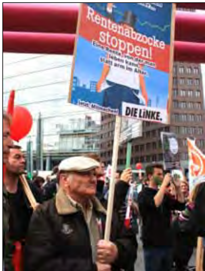
Beim Protest „Umfairteilen“ in Berlin.

Wie auch in den vergangenen Sitzungen stand der von SPD und CDU beschlossene Personalabbau in den Berliner Bezirken im Mittelpunkt der Debatten. Marzahn-Hellersdorf soll nach Auffassung der Landeskoalition 175 Stellen streichen. Die Linksfraktion stellte klar, dass dies ohne den Wegfall bürgernaher Dienstleistungen wohl kaum zu schaffen sei. Schon jetzt ist der Kinderschutz nicht mehr gewährleistet, und das Bürgeramt in Mahlsdorf wur-