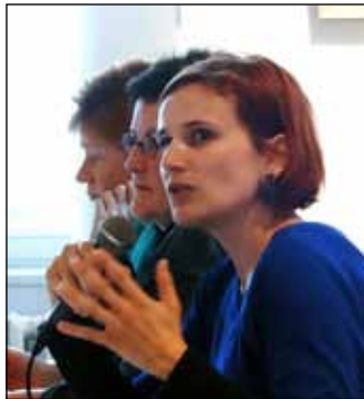
Katja Kipping am 3.10. zu Gast im Schloss Biesdorf. Weit mehr als 100 am Thema „Rente“ Interessierte waren gekommen, und viele diskutierten mit.

jobs betreffen in der Mehrheit Frauen, was niedrigste Renten zur Folge hat. Dem möchte DIE LINKE mit ihrer Solidarischen Rentenversicherung begegnen, wohl wissend, dass man bei den Entgelten für die Arbeitenden beginnen muss!