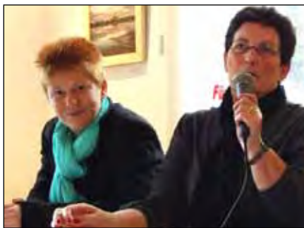
Dagmar Pohle, Sozialstadträtin (re.), die moderierte, und Petra Pau, MdB, bei der Veranstaltung im Schloss mit Katja Kipping.

Zwei Wochen zuvor bekam der „Wahnsinn“, also der gesamtdeutsche, neue Nahrung. Das Bundesministerium für Arbeit hatte Mitte September 2012 den aktuellen Armuts-und-Reichtums-Bericht vorgelegt. Sein Fazit: Trotz aktueller Krise werden die Reichen immer reicher. Die Armen hingegen werden immer zahlreicher